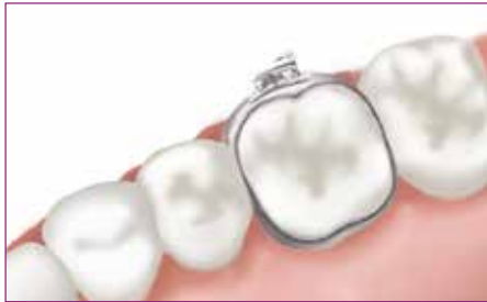
4 Seleccione la banda y pruébela en boca