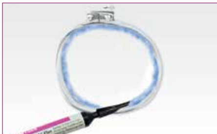
7 Aplique el material en el interior