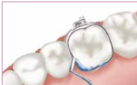
8 Coloque la banda en su sitio y retire el exceso