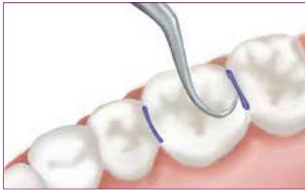
1 Retire los separadores elásticos