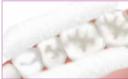
5 Aíse los dientes y mantenga el campo seco