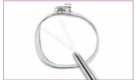
6 Seque la banda