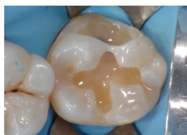
Applicering af flowmateriale