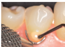
Applicering af flowmateriale