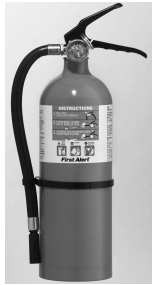
Extintor de incendios Modelo FE4A60BC