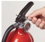
Rompa el sello y tire del pasador de seguridad

La unidad no funciona cuando está en su dispositivo de montaje. Para poder descargar su contenido a fin de combatir un incendio, se debe retirar el extintor de dicho dispositivo.