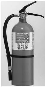
Fire Extinguisher Model FE4A60BC