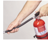
Presione la palanca para descargar el polvo