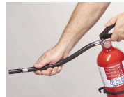
Dirija la boquilla hacia la base del fuego