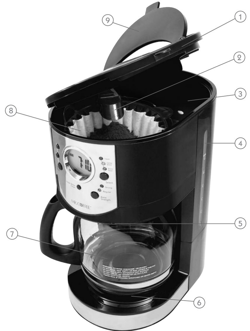
DIAGRAMA DE LAS PARTES