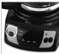
(Figure 1 – Set Delay)

To check the programmed time, push the SET DELAY button. The display will show the time you have programmed the coffee to brew.