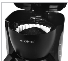
(Figure 2 – Adding water and ground coffee)

6. Pour the water into the water reservoir. Close the lid and place the empty decanter onto the warming plate.