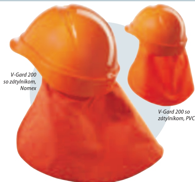
V-Gard 200 so zátylníkom, Nomex