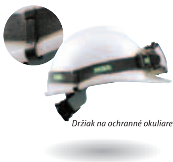
Držiak na ochranné okuliare