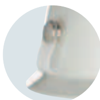
Záchytný klip (vzadu)