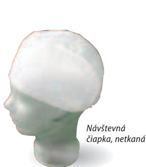
Návštevná čiapka, netkaná