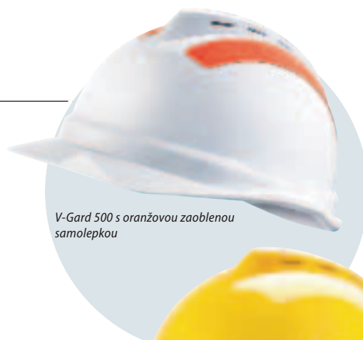
V-Gard 500 s oranžovou zaoblenou samolepkou