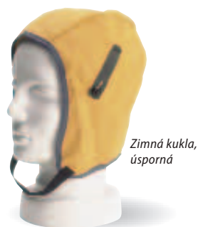
Zimná kukla, úsporná