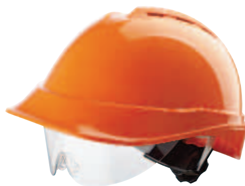
V-Gard 200 so sklopným prieszorom