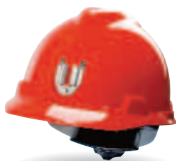
Kovový držiak (predný)