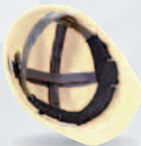
Potítka s penou