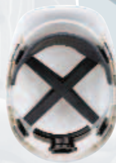
V-Gard 500 s upínaním Fas-Trac