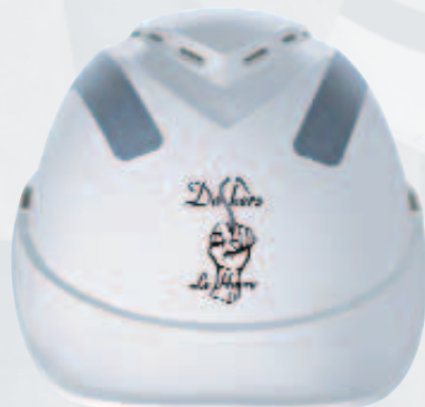
V-Gard 200 biela s jednofarebným logom