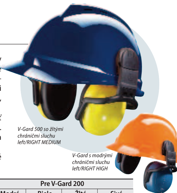
V-Gard 500 so žltými chráničmi sluchu left/RIGHT MEDIUM

V tabuľke nájdete pasívne chrániče sluchu left/RIGHT. Pre elektronické chrániče sluchu žiadajte samostatný prospekt.