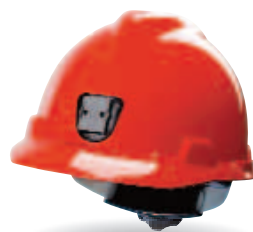
Plastový držiak (predný)