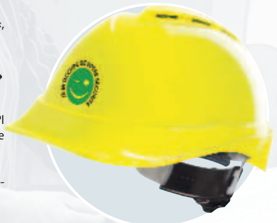
V-Gard 200 žltá s dvojfarebným logom