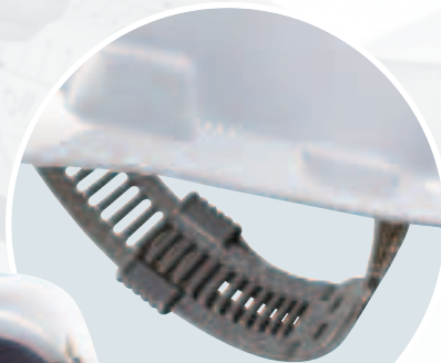
V-Gard 500 s upínaním Staz-On