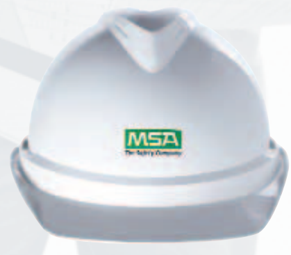
V-Gard 500 biela s dvojfarebným logom