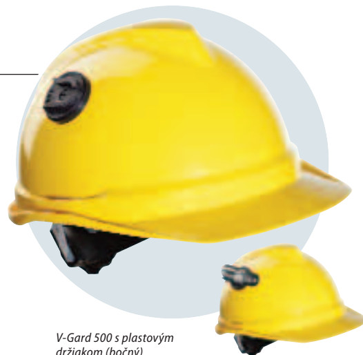
V-Gard 500 s plastovým držiakom (bočný)

V-Gard a V-Gard 500 s dvomi plastovými držiakmi udržujú svoju elektroizolačnú odolnosť (440 V AC) a antistatické vlastnosti.