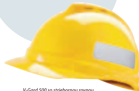
V-Gard 500 so striebornou rovnou samolepkou