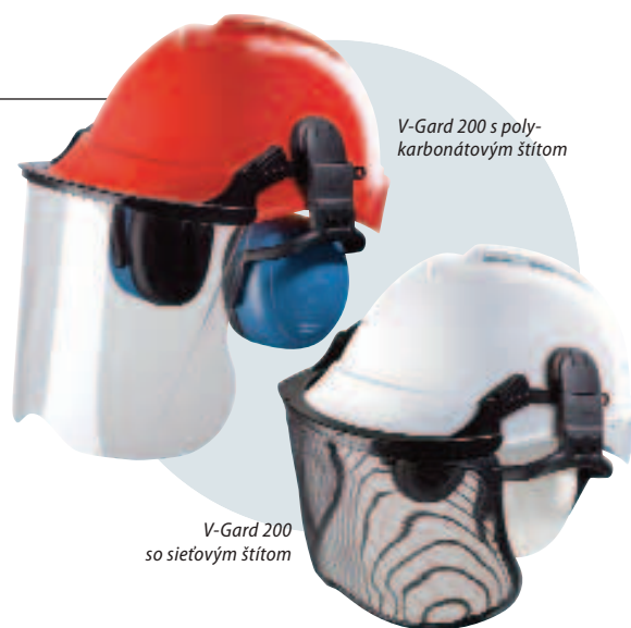
V-Gard 200 s polykarbonátovým štítom