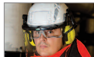
Ranuras estándar para acoplar orejeras o pantalla exterior