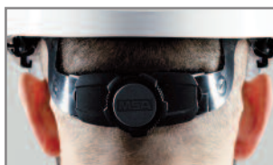
Acolchado de confort FasTrac III / banda de nuca baja