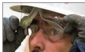
El área de agarre facilita el repliegue del visor