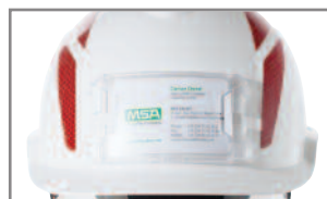
Tiras adhesivas y soporte de distintivos opcionales