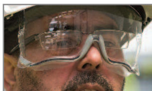
Junta de goma exclusiva para garantizar una protección ocular sin resquicios