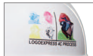
Impresión a color de primera calidad