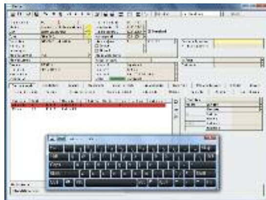
Gestione totale dell'equipaggiamento, comprese le notifiche di manutenzione scaduta.