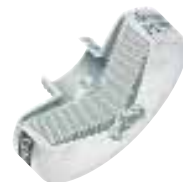
Filter za čestice