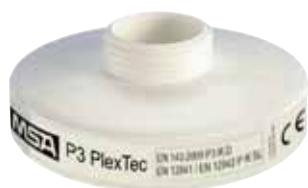
Partikelfilter P3 PlexTec