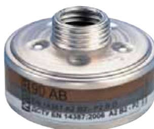
Gasfilter 90 AB