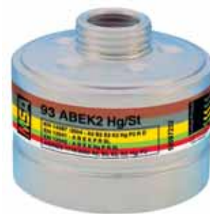
Kombinationsfilter 93 ABEK2-Hg/St