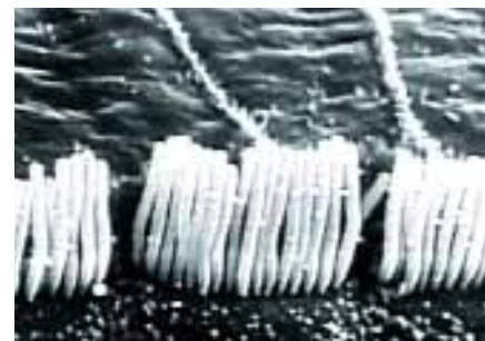
Friska hörselceller under mikroskop

MSA har utvecklat produkter tillsammans med jägare och skyttar i över 20 år och du får garanterat ett mycket effektivt hörselskydd oavsett vilken lösning du än väljer.