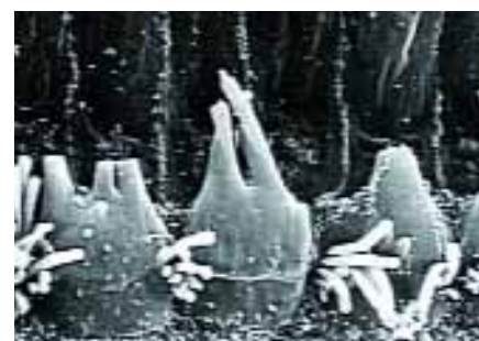
Synlig hörselskada: skadade hörselceller under mikroskop