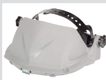
V-Gard Headgear para aplicaciones con temperaturas elevadas