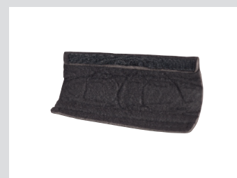
Sudadera de repuesto