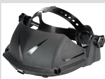
V-Gard Headgear estándar