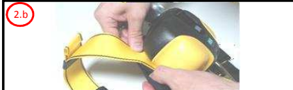
2.b Feche a fita com velcro através das Fitas Superiores do Cinturão Paraquedista

3 Vista o Cinturão Paraquedista com o Trava Quedas