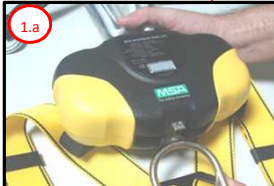
1.a Posicionar a Argola Dorsal do Cinturão

1 Conectar o Trava Quedas à Argola Dorsal do Cinturão Paraquedista