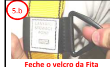
5.b Feche o velcro da Fita