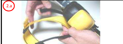
2.a Passe a fita com velcro através das Fitas Superiores do Cinturão Paraquedista

2 Ajustar as Fitas com velcro do Trava Quedas ao Cinturão Paraquedista