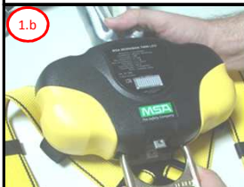
1.b Encaixar a Argola Dorsal do Cinturão

2 Ajustar as Fitas com velcro do Trava Quedas ao Cinturão Paraquedista