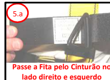
5.a Passe a Fita pelo Cinturão no lado direito e esquerdo

5 Passe as Fitas ao Cinturão Paraquedista na região peitoral