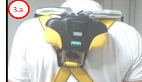
3.a Vista o Cinturão Paraquedista com o Trava Quedas preso a Ancoragem

3 Vista o Cinturão Paraquedista com o Trava Quedas