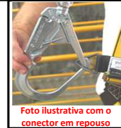
Foto ilustrativa com o conector em repouso