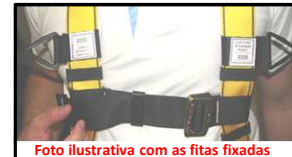
Foto ilustrativa com as fitas fixadas