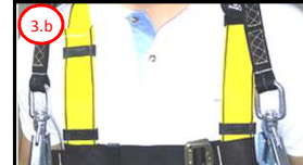
3.b Posicione os conectores na região peitoral

4 Fitas com velcro para Ancoragem dos Conectores