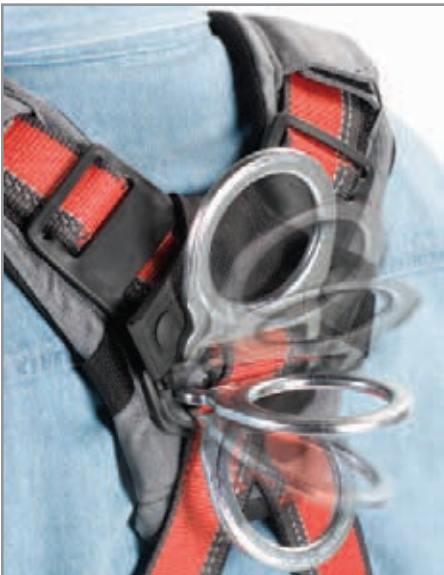
Anillo tipo D en espalda con 3 posiciones ajustables para mayor comodidad y facilita el ajuste de su línea de vida o retráctil.