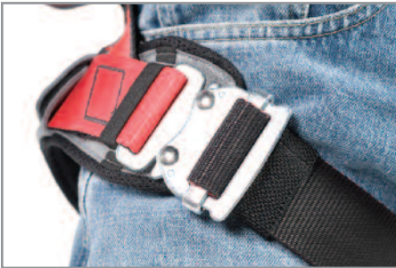
Disponible con hebillas de ajuste rápido, que facilitan la conexión y el ajuste en el pecho y piernas.