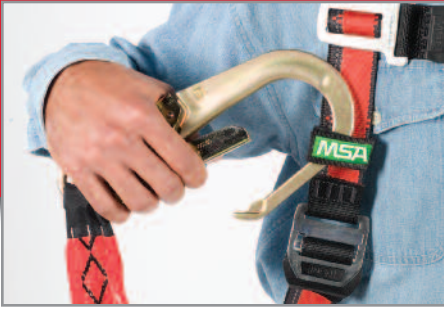
Clip para portar Línea de Vida.