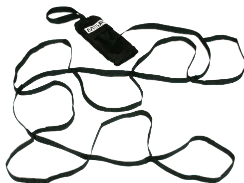
Reductor de trauma por suspensión Safety Step