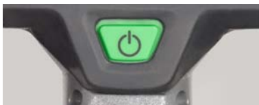
ตัวบ่งชี้บนหน้าจอ (ทุกรุ่น)