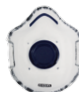
3251 - P2 V OR