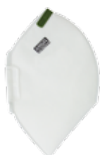
4210 - P1

Saiba qual é a classe de seu respirador através das cores presentes na válvula e no clipe nasal: verde (P1) ou amarelo (P2).