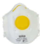
3221 - P2 V