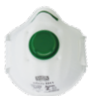
3211 - P1 V