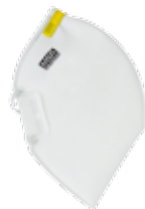
4220 - P2