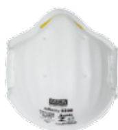
3220 - P2