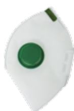
4211 - P1 V