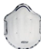
3250 - P2 OR