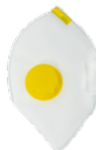
4221 - P2 V