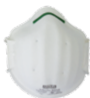
3210 - P1

Clipe nasal e válvula de exalação com cores diferentes, que torna fácil a identificação da classe do respirador: verde (P1), amarelo (P2) ou azul (P2 OR - odor removal).