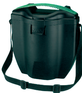
Boîte Avantage 3000