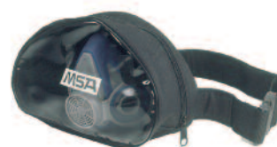
Étui pour Avantage 200 LS