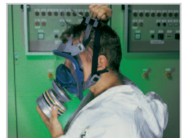
Passez le harnais au-dessus de la tête