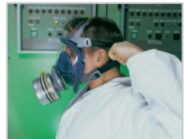
Serrez les deux sangles inférieures

La série de masques complets Advantage 3000 est garante à la fois d'une protection et d'un confort inégalés. La ligne d'étanchéité souple en silicone hypoallergénique assure un port sans pression. Le large oculaire panoramique à optique corrigée garantit une vision claire et sans déformations, et la couleur bleu-gris des différents composants donne un aspect esthétique au masque.