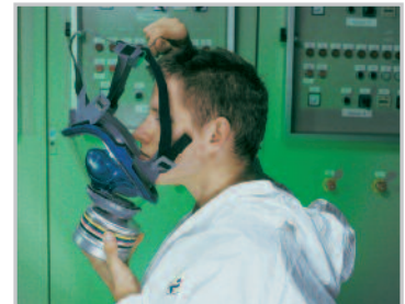
Placez le menton dans la mentonnière