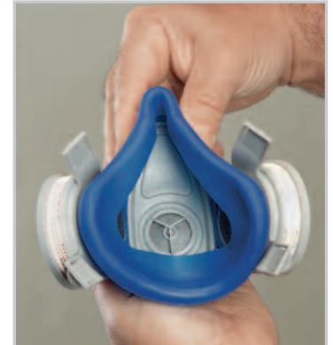
Système d'adaptation au visage Anthrocurve

L'Advantage 200 LS est un demi-masque confortable, efficace et économique. Il est idéal pour les applications présentant divers risques pour les travailleurs, tels que de hautes concentrations de fumées, de brouillards et de gaz.