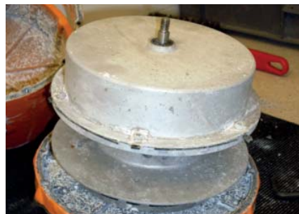
Carcasa del resorte