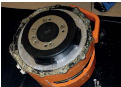
Cubierta del amortiguador removida