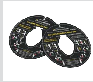
Etiquetas de reemplazo