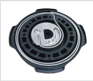
Kit de reemplazo de amortiguador de impacto