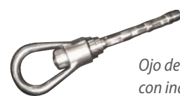
Ojo de acero inoxidable con indicador de impacto (para turbinas eólicas europeas únicamente)