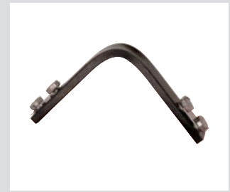
Punto de anclaje