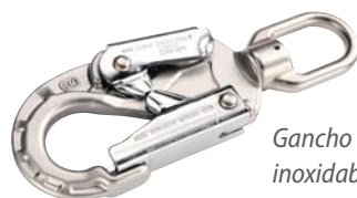
Gancho de acero inoxidable con indicador de impacto

Los accesorios adicionales que están disponibles con la retráctil sellada Latchways Sealed SRL, son los siguientes: