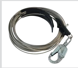
Kit de reemplazo de cable de acero inoxidable