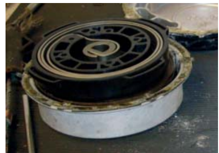
Amortiguador de impacto

Nota: EN 360:2002 Cláusula 4.7 requiere que el dispositivo deberá ser expuesto por 24 a un rocío de sal neutra. Sin embargo para demostrar la robustez del producto de Latchways®, la exposición se incrementó a 1000 horas, después de las cuales se descubrió que cumplía con los requisitos de la cláusula 4.7.