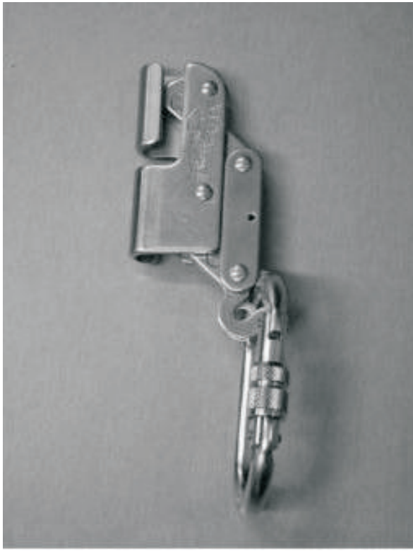
Trava quedas para cabo de aço + conector oval Comprimento: 0,15 metros Espaço mínimo abaixo dos pés do usuário: 3 metros