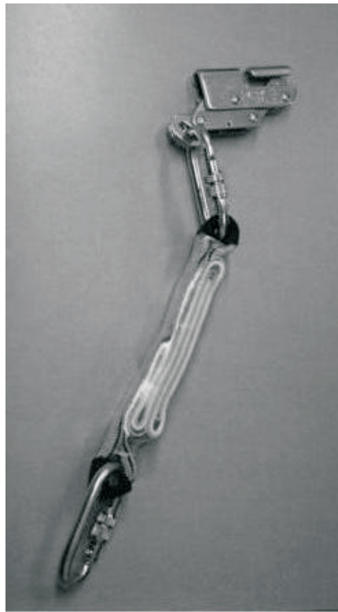
Trava quedas para cabo de aço + conector oval + absorvedor de energia comprimeto + conector oval Comprimento: 0,48 metros Espaço mínimo abaixo dos pés do usuário: 4,2 metros