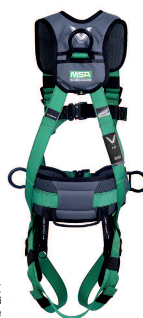
( Vi post