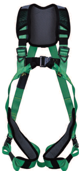
(1) Vista frontal