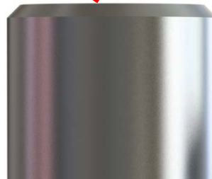
Imagem 3 – Ponta reta da haste