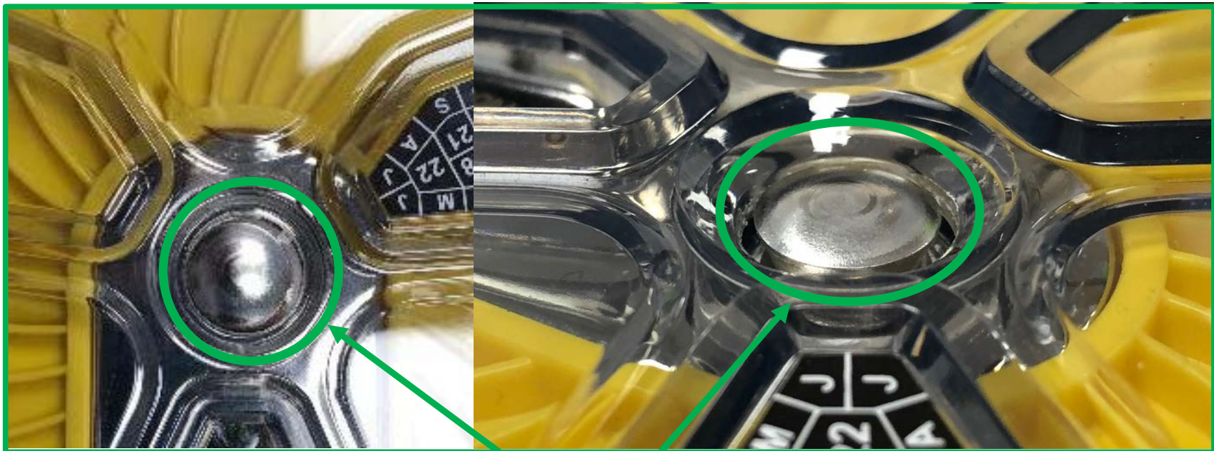
Imagem 2 – Ponta alargada da haste

Realize a etapa 2b da inspeção para confirmar o estado aceitável