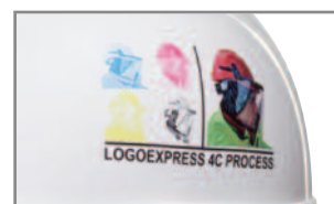
Personnalisation par logo : qualité sans égale

Vous avez besoin de plus d'informations ?