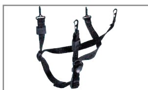
Jugulaire 4 points