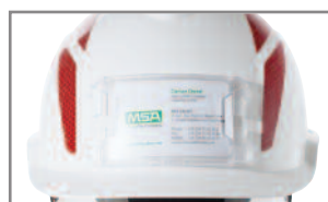
En option : Stickers haute visibilité et Porte-Badges