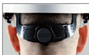
Sangle de nuque qui descend sous le rocher