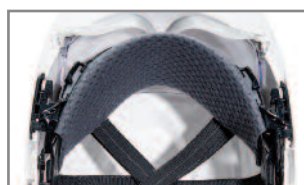
Bandeau antisueur remplaçable tout confort